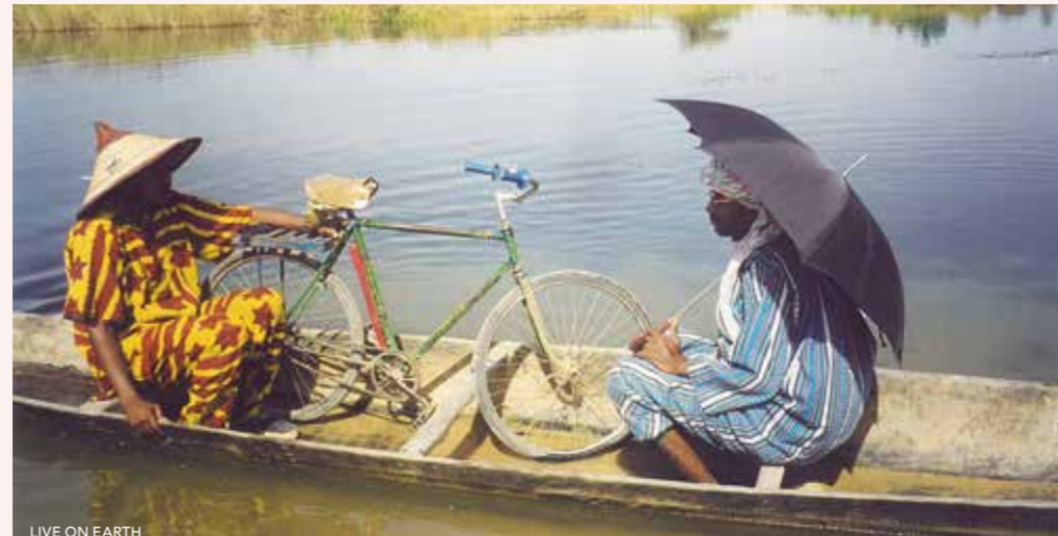
LIVE ON EARTH