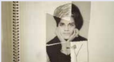
Iran – Bilder der Freiheit

19:00 RADIOGRAPH OF A FAMILY + ONCE LAKE URMIA