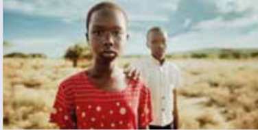
Deutschlandpremiere: Kinder- und Frauenrechte in Kenia