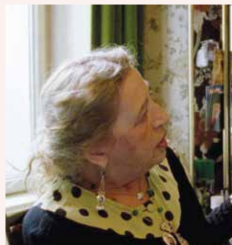
DER OFFENE BLICK