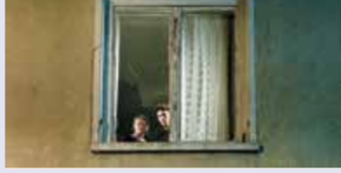
Ökonomie des Alltags FRESA Y CHOCOLATE (ERDBEER UND SCHOKOLADE) Kuba im Film